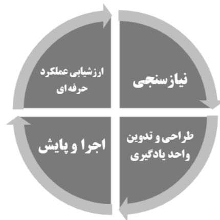
شکل شماره ۴: چرخه فعالیت کارآموزی

این فرایند شامل چهار مرحله است که عبارتند از: «نیازسنجی»، «طراحی و تدوین واحدهای یادگیری»، «اجرا و پایش» و «ارزشیابی عملکرد حرفه ای». شکل شماره ۴، چرخه فرایند کارآموزی را نشان می دهد: