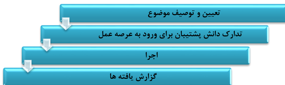
شکل شماره ۲: چرخه درس آموزش پژوهی در عرصه عمل

چرخه آموزش پژوهی ناظر به فرایند عمل و تأمل بر آن که مراحل آن در شکل شماره ۲، نشان داده شده است: