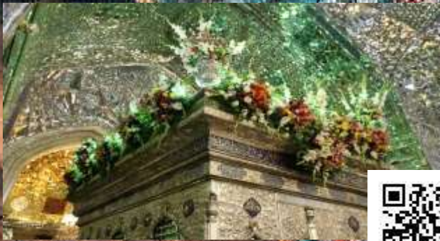
حرم مطهر شاهچراغ علیه السلام