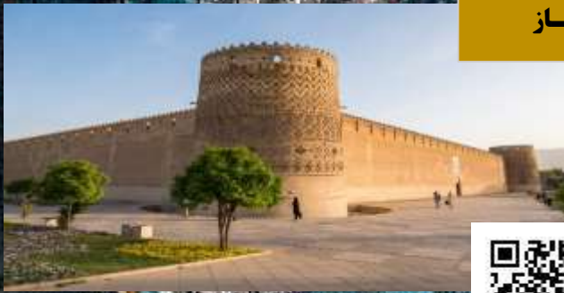
ارگ کریم خان زند