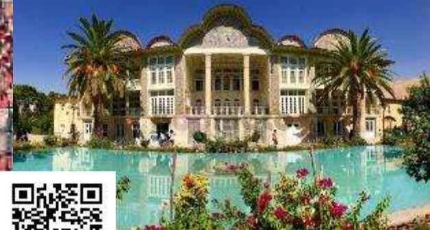
باغ ارم شیراز