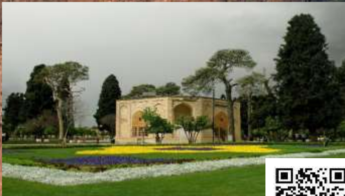
باغ جهان نما