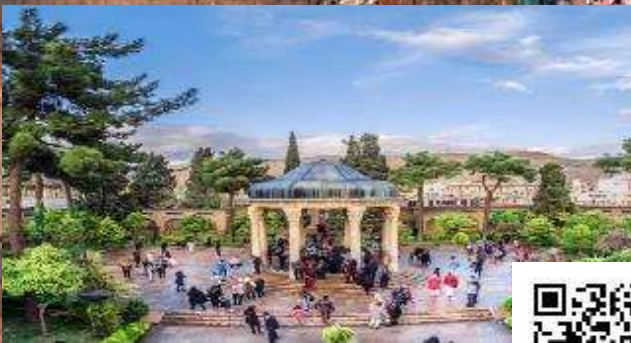
آرامگاه حافظ شیرازی