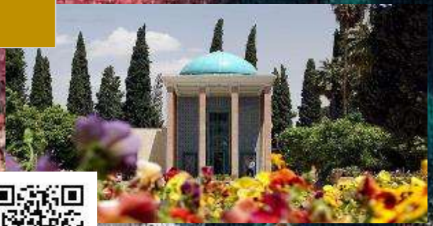
آرامگاه سعدی شیراز