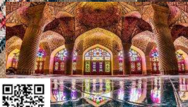
مسجد نصیر الملک